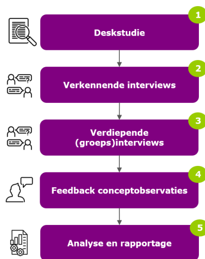
Figuur 1. Onderzoeksproces

Om invulling te geven aan de opzet van een lerende evaluatie is gebruik gemaakt van vier dataverzamelmethode: deskstudie, verkennende interviews, verdiepende (groeps)interviews en (schriftelijke) feedback op conceptobservaties (zie Figuur 1). De deskstudie had als doel om een globaal overzicht te krijgen van het Versnellingsplan. Hiervoor zijn diverse documenten bestudeerd, waaronder jaarplannen, jaarverslagen, visiedocumenten, voortgangsrapportages, verantwoordingsdocumenten, de oorspronkelijke Versnellingsagenda en het initiële Versnellingsplan uit 2018. De deskstudie diende tevens als input voor het interviewprotocol. Vervolgens zijn een reeks verkennende interviews gehouden met het programmateam, de stuurgroep en enkele hoger onderwijs (ho) instellingen binnen en buiten het Versnellingsplan om meer inzicht te krijgen in wat het Versnellingsplan als geheel in de praktijk teweegbrengt en de procesmatige werking van de verschillende teams en zones. De interviews zijn ook gebruikt om de bevindingen uit de deskstudie aan te vullen. Hierna zijn een reeks verdiepende (groeps)interviews gehouden met de kernteams (aanvoerders en verbinders) van de zones en werkgroepen en de zoneleden. Het doel hiervan was het in kaart brengen van de werking van de verschillende zones alsook het ophalen van de ervaringen vanuit de individuele zones (en werkgroepen). In totaal zijn 85 personen gesproken in de beide interviewrondes (zie Bijlage 1).